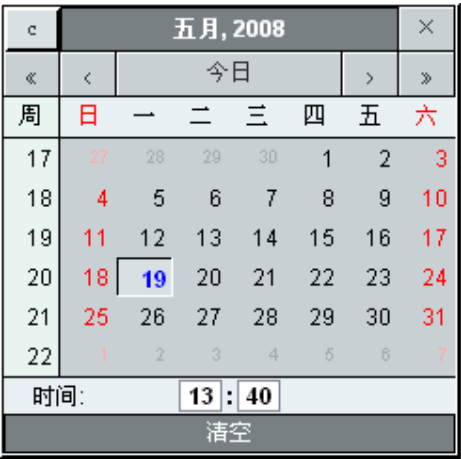
图 2.3.1 时间图